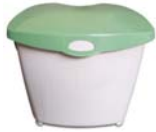
CUBETA DE 3-GALONES