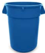
20-GALLON ROUND W/ LID 23" H