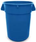
20-GALONES REDONDO CON TAPA 23" H