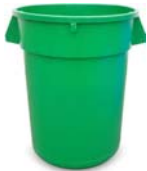
32-GALLONES REDONDO CON TAPA 28" H