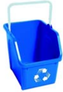
CANASTA DE 6-GALONES 15" H